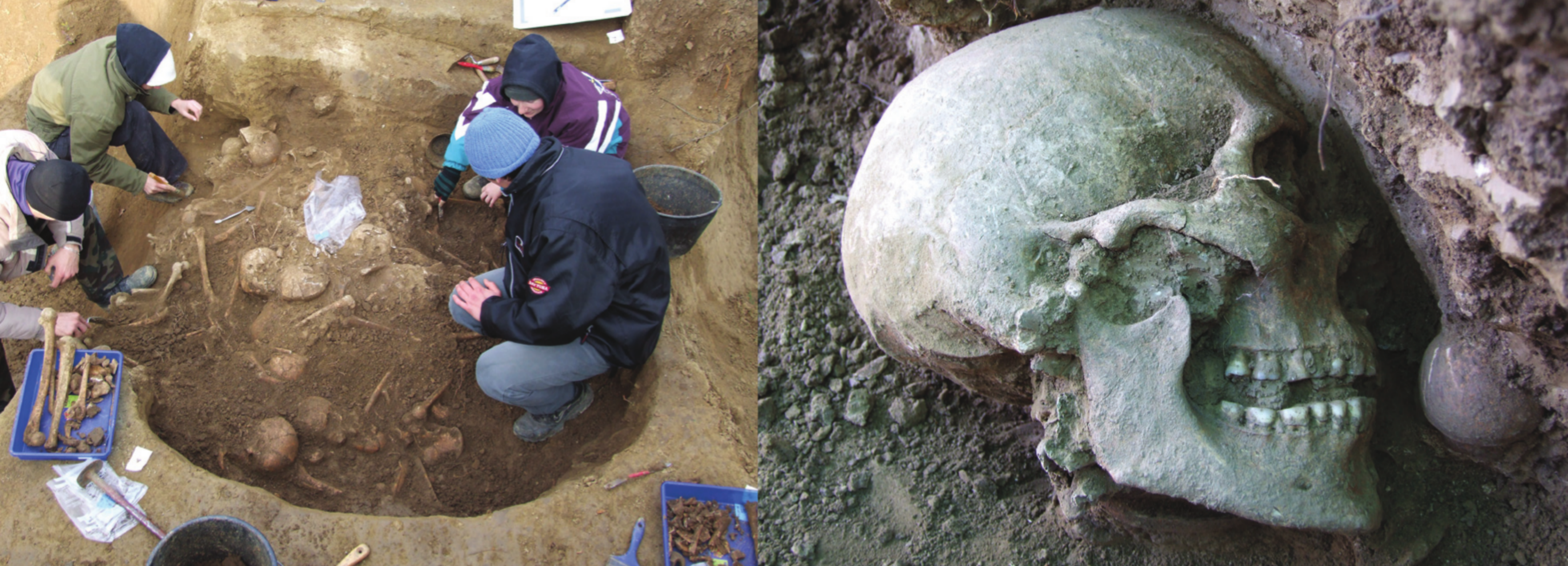
Arheološko istraživanje lokaliteta Potočani: (A) radna fotografija tijekom istraživanja; (B) detalj; (C) situacija tijekom istraživanja.

Kako ne bi ostali zapisani samo u znanstvenim radovima, vrijeme je da ih približimo lokalnom stanovništvu, lokalnoj zajednici, kao i čitavoj zainteresiranoj javnosti. Ispričat ćemo vam zato jednu priču, priču o ljudima koji su u Potočanima, malom mjestu u Požeškoj kotlini, živjeli jednom davno.