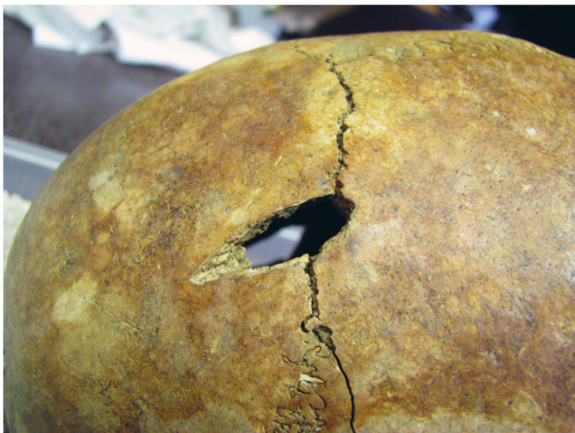
Perimortalna ubodna ozljeda na čeonj kosti žene starosti između 20 i 35 godina.